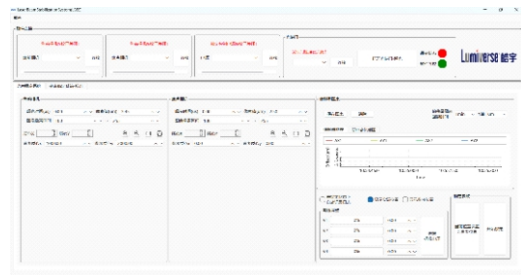
图3 光束指向稳定系统控制软件